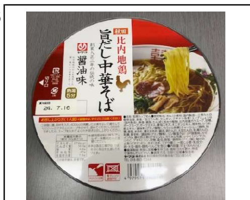
商品名 比内地鶏旨だし中華そば（カップ） 売価 500円（税抜） 内容量 1人前 JANコード 4979971790011