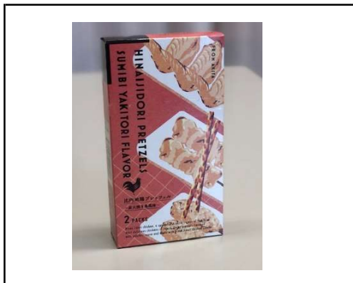
商品名 比内地鶏プレッツェル 売価 280円（税抜） 内容量 45g JANコード 4562418240707