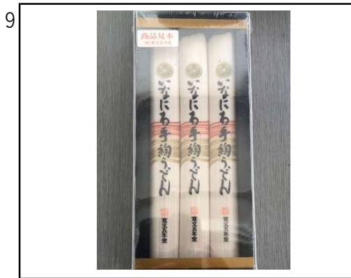
商品名 寛文五年堂稲庭手餛飩 売価 1,000円 (税抜) 内容量80g×3 JANコード 4950034000032