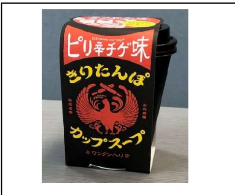
商品名 きりたんぼカップ ピリ辛チゲ味 売価 550円（税抜） 内容量 106g JANコード 4582438051169