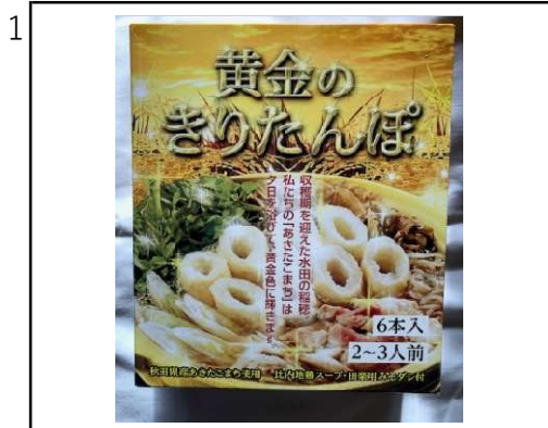
商品名 黄金のきりたんぽ6本入 売価 770円 (税別) 内容量 2~3人前 JANコード 4956877410014