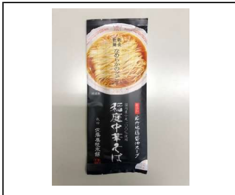
商品名 稲庭中華そば 醤油味 売価 600円 (税抜) 内容量 2人前 JANコード 4992099000183