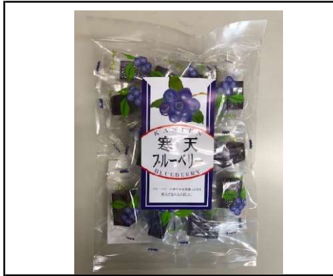
商品名 寒天ブルーベリー 売価 500円 (税抜) 内容量 220g JANコード 4974549000585