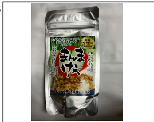
商品名 まんまけえ 売価 426円(税抜) 内容量 100g JANコード 4580199980247