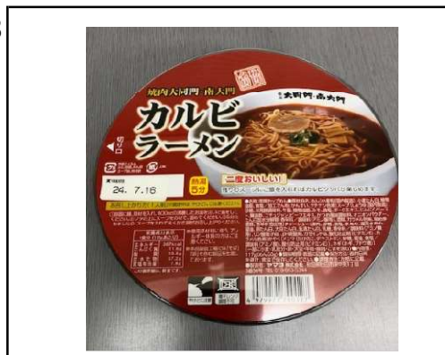
商品名 焼肉大同門・南大門カルビラーメン（カップ） 売価 430円（税抜） 内容量 1本 JANコード 4979971790127