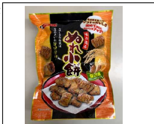
商品名 ぬれ小餅 売価 350円 (税抜) 内容量 140g JANコード 4970311200085