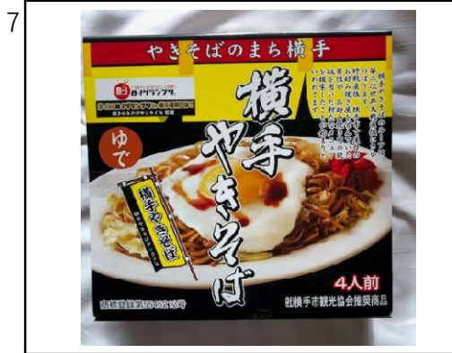
商品名 横手や焼きそば (箱) 売価 1,100円 (税抜) 内容量 4人前 JANコード 4920539150402