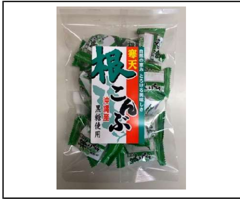
商品名 根昆布寒天 売価 570円 (税抜) 内容量 240g JANコード 4979354030079