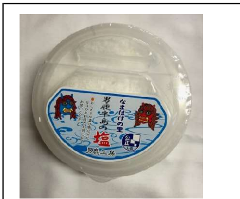
商品名 男鹿半島の塩 タッパー入 売価 348円（税抜） 内容量 80g JANコード 4560172746046