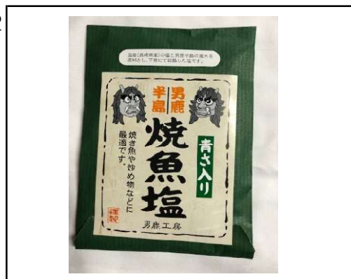
商品名 焼魚塩 売価 220円（税抜） 内容量 40g JANコード 4560172746329