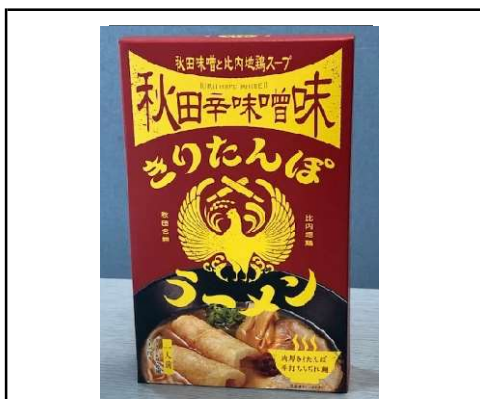
商品名 きりたんぽラーメン秋田味噌味 売価 554円（税抜） 内容量 185g JANコード 4582438058809