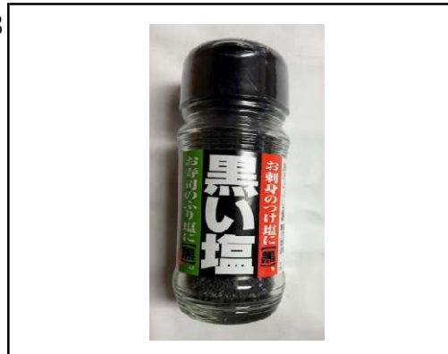
商品名 黒い塩 売価 500円（税抜） 内容量 40g JANコード 4560172747005