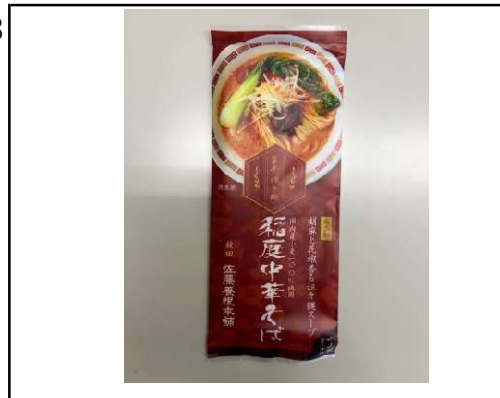
商品名 稲庭中華そば 坦々スープ 売価 700円 (税抜) 内容量 2人前 JANコード 4992099000961