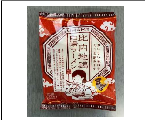
商品名 比内地鶏白湯ラーメン 醤油味 売価 300円 (税抜) 内容量 1人前 JANコード 4562418240103