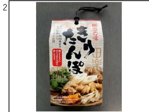
商品名 きりたんぽ6本入り 売価 880円 (税抜) 内容量 2~3人前 JANコード 4956877400046