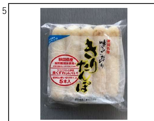
商品名 きりたんぽ5本入り (袋) 売価 630円 (税抜) 内容量 70g x 5 JANコード 4956877980036