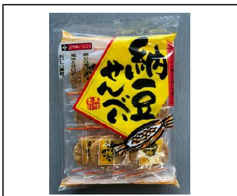
商品名 納豆せんべい 売価 250円 (税抜) 内容量11枚 JANコード 4970311045686