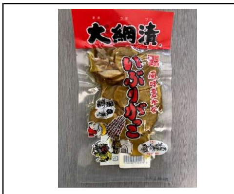
商品名 大綱漬いぶり スライス 売価 530円(税抜) 内容量150g JANコード 4906895000223