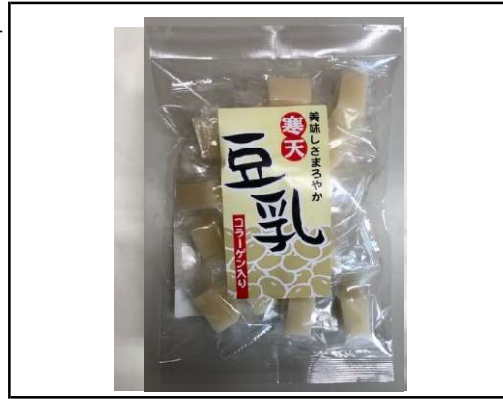
商品名 寒天豆乳 売価 570円 (税抜) 内容量 240g JANコード 4979354030086