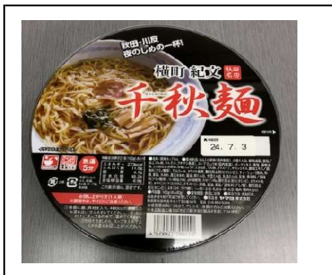
商品名 横町 紀文 千秋麺（カップ） 売価 500円（税抜） 内容量 1人前 JANコード 4979971790110