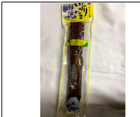
商品名 雄勝野きむらやいぶりがっこLサイズ 売価 759円 (税抜) 内容量 260g JANコード 4969930000039