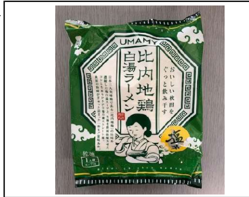
商品名 比内地鶏白湯ラーメン 塩味 売価 300円 (税抜) 内容量 1人前 JANコード 4562418240110