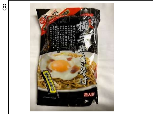
商品名 横手焼きそば (袋) 売価 550円 (税抜) 内容量 2人前 JANコード 4920539150204