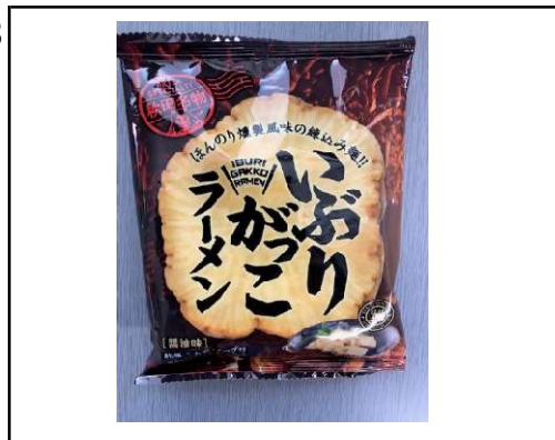
商品名 いぶりがっこラーメン 売価 330円 (税抜) 内容量 1人前 JANコード 4582438058892