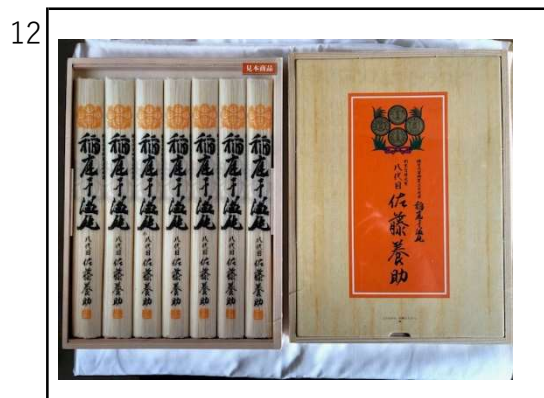
商品名 佐藤養助稲庭干餛飩MYS30N 売価 3,000円 (税抜) 内容量 80g×7 JANコード 4964206003189