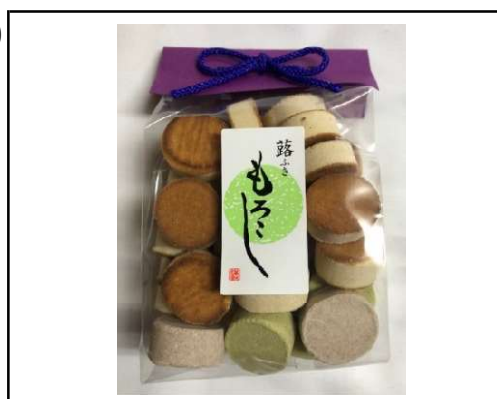
商品名 落巾着もろこし 売価 350円（税抜） 内容量 120g JANコード 4954023015311