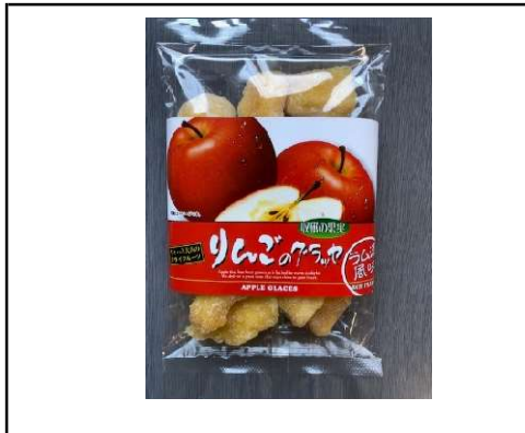
商品名 りんごグラッセ 売価 500円 (税抜) 内容量 200g JANコード 4990855065254