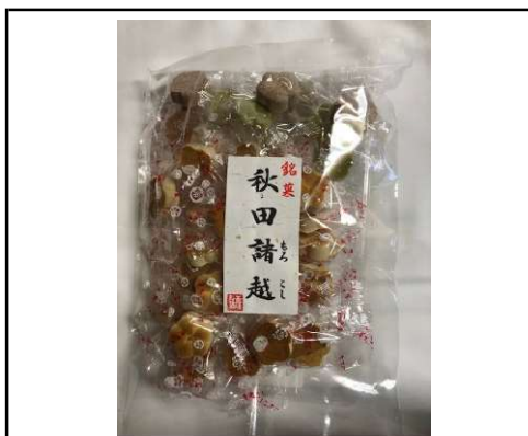
商品名 三色つつみもろこし 売価 350円 (税抜) 内容量 130g JANコード 4963216101199