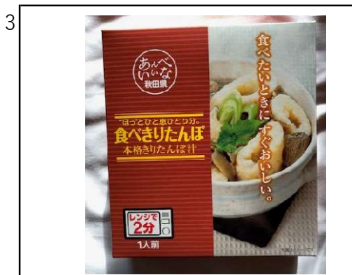
商品名 食べきりたんぽ 売価 600円 (税抜) 内容量 1人前 JANコード 4956877410014