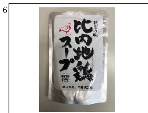
商品名 比内地鶏スープ 売価 280円 (税抜) 内容量 200g JANコード 4956877410069