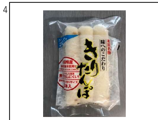
商品名 きりたんぽ3本入り (袋) 売価 390円 (税抜) 内容量 70g x 3 JANコード 4956877970037