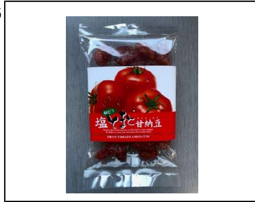
商品名 塩トマト甘納豆 売価 500円 (税抜) 内容量 150g JANコード 4990855065087