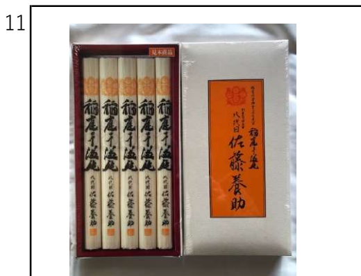
商品名 佐藤養助稲庭干餛飩MYS20N 売価 2,000円 (税抜) 内容量80g×5 JANコード 4964206002182