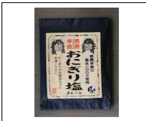
商品名 おにぎり塩 売価 220円（税抜） 内容量 40g JANコード 4560172746305