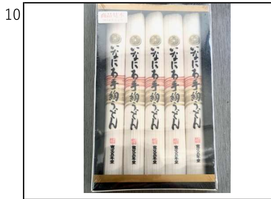
商品名 寛文五年堂稲庭手餛飩 売価 1,500円 (税抜) 内容量80g×5 JANコード 4950034000056