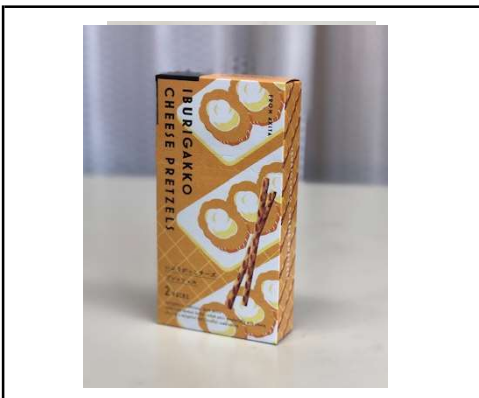
商品名 いぶりがっこプレッツェル 売価 280円（税抜） 内容量 45g JANコード 4562418240691