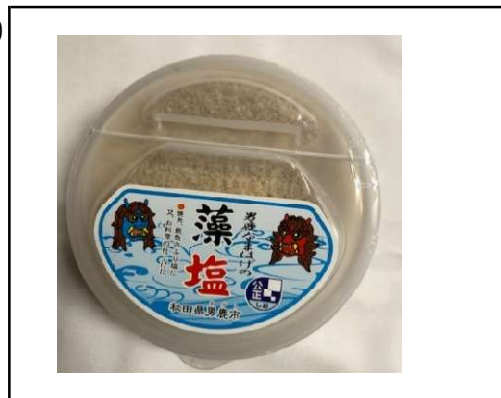
商品名 男鹿半島の藻塩 タッパー入 売価 458円（税抜） 内容量 80g JANコード 4560172746053