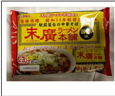
商品名 末廣ラーメン 売価 570円 (税抜) 内容量 2食入 JANコード 4963978122074