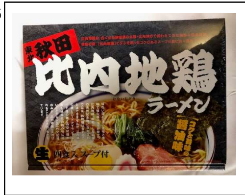
商品名 比内地鶏ラーメン 売価 1000円 (税抜) 内容量 4食入り JANコード 4972874605574