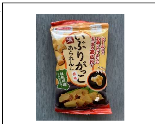
商品名 いぶりがっこ風味あられんこ 売価 150円 (税抜) 内容量 40g JANコード 4970311056494