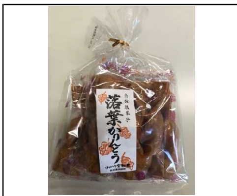
商品名 落葉かりんとう巾着 売価 260円 (税抜) 内容量 5本 JANコード 4955623003319