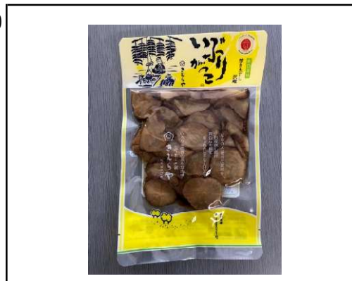
商品名 雄勝野きむらやいぶりがっこスライス 売価 541円 (税抜) 内容量 150g JANコード 4969930000664