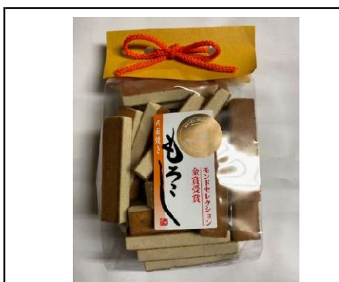
商品名 両面巾着もろこし 売価 350円（税抜） 内容量 120g JANコード 4954023015014