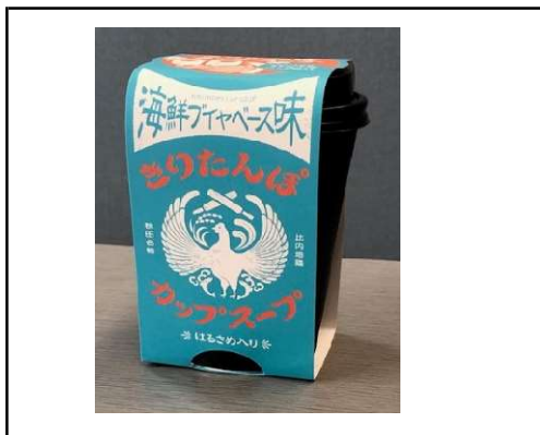
商品名 きりたんぼカップ海鮮ベース味 売価 550円（税抜） 内容量 106g JANコード 4582438051114