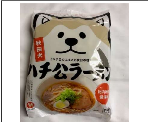
商品名 ハチ公ラーメン 比内地鶏醤油味 売価 300円 (税抜) 内容量 1人前 JANコード 4582438058885