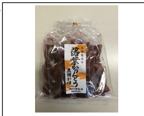
商品名 落葉かりんとう巾着黒糖がけ 売価 260円 (税抜) 内容量 5本 JANコード 4955623003326