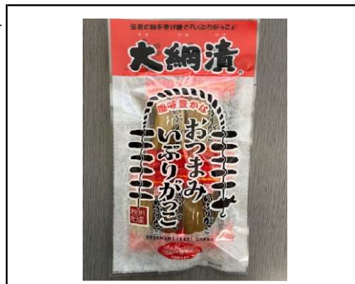
商品名 大綱漬いぶり ピロー入り 売価 550円(税抜) 内容量 JANコード 4906895001701