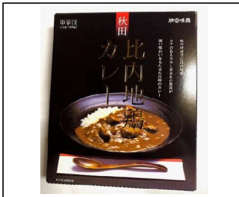
商品名 比内地鶏カレー 売価 600円(税抜) 内容量 1人前 JANコード 4997683010272