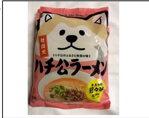
商品名 ハチ公ラーメン まろやか坦々味 売価 300円 (税抜) 内容量 1人前 JANコード 4582438058908