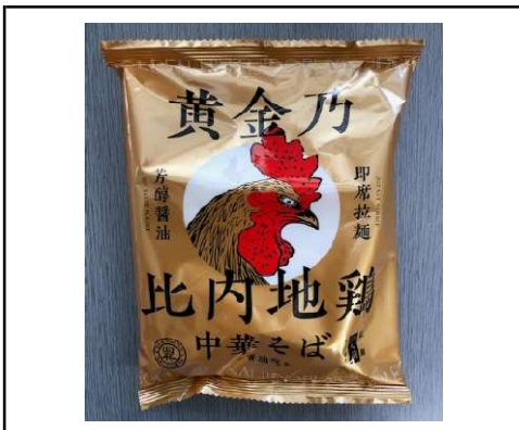
商品名 黄金乃比内地鶏中華そば 売価 300円 (税抜) 内容量 1人前 JANコード 4582438058878