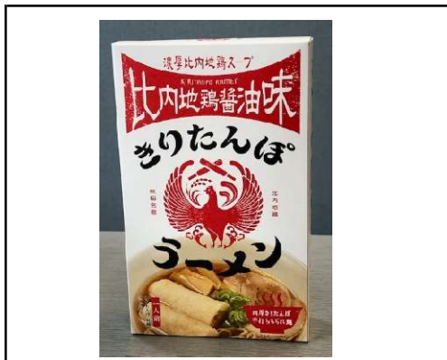
商品名 きりたんぼラーメン比内地鶏醤油味 売価 554円（税抜） 内容量 190g JANコード 4582438058786