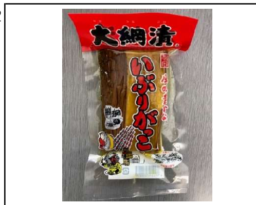
商品名 大綱漬いぶり ミニ 売価 550円(税抜) 内容量150g JANコード 4906895000025