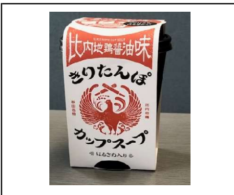
商品名 きりたんぼカップ 比内地鶏醤油味 売価 550円（税抜） 内容量 106g JANコード 4582438051107