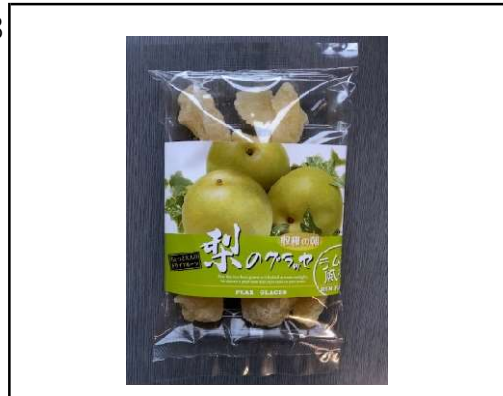
商品名 梨のグラッセ 売価 500円 (税抜) 内容量 180g JANコード 4990855065117