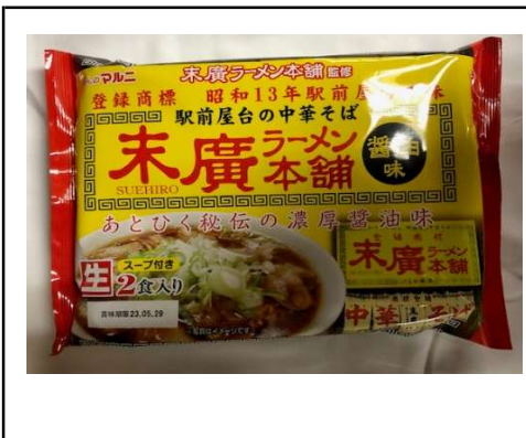
商品名 末廣ラーメン 売価 570円 (税抜) 内容量 2食入 JANコード 4963978122074