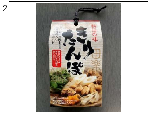
商品名 きりたんぽ6本入り 売価 880円 (税抜) 内容量 2~3人前 JANコード 4956877400046