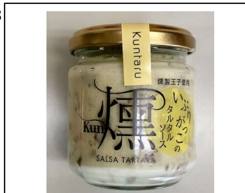
商品名 いぶりがっこタルタルソース 売価 750円 (税抜) 内容量 160g JANコード 4969670025125