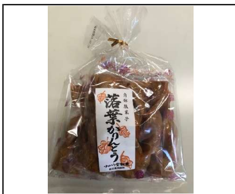
商品名 落葉かりんとう巾着 売価 260円 (税抜) 内容量 5本 JANコード 4955623003319