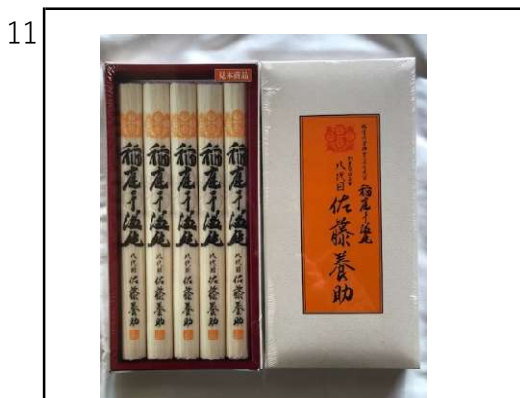
商品名 佐藤養助稲庭干饅頭MYS20N 売価 2,000円 (税抜) 内容量80g×5 JANコード 4964206002182