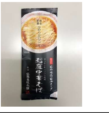
商品名 稲庭中華そば 醤油味 売価 600円 (税抜) 内容量 2人前 JANコード 4992099000183