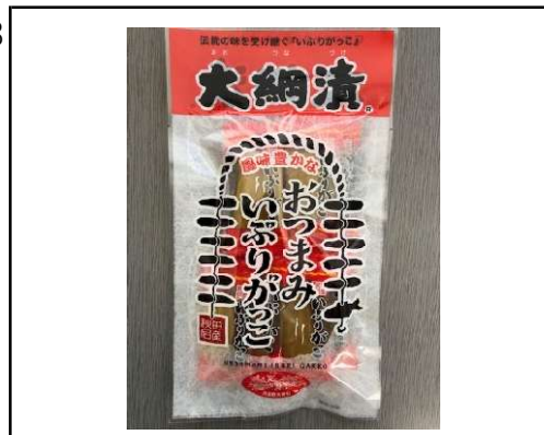
商品名 大綱漬いぶり ピロー入り 売価 577円 (税抜) 内容量 JANコード 4906895001701