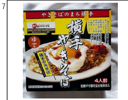
商品名 横手や焼きそば (箱) 売価 1,100円 (税抜) 内容量 4人前 JANコード 4920539150402