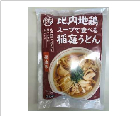
商品名 比内地鶏スープで食べる稲庭うどん 醤油味 売価 1,080円 (税抜) 内容量 3人前 JANコード 4997683060321