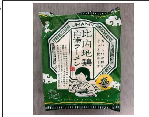
商品名 比内地鶏白湯ラーメン 塩味 売価 300円 (税抜) 内容量 1人前 JANコード 4562418240110