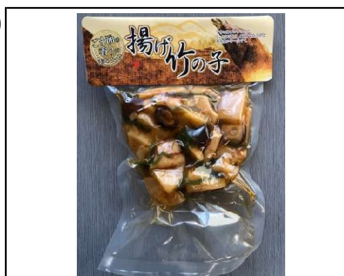
商品名 揚げ竹の子 売価 500円 (税抜) 内容量 250g JANコード 4990855051936