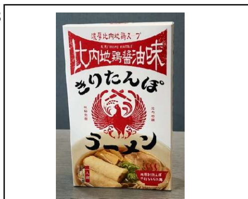
商品名 きりたんぽラーメン比内地鶏醤油味 売価 554円（税抜） 内容量 190g JANコード 4582438058786