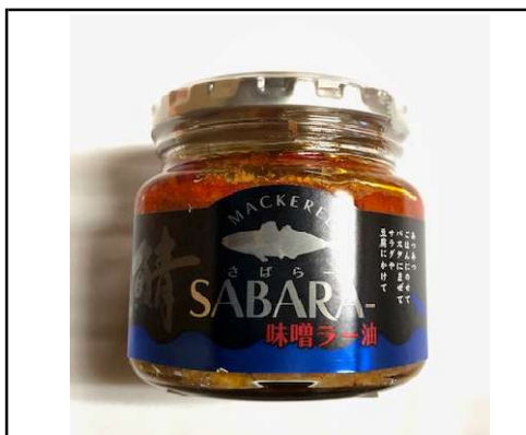
商品名 さば味噌ラー油 売価 700円 (税抜) 内容量 190g JANコード 4990855052674