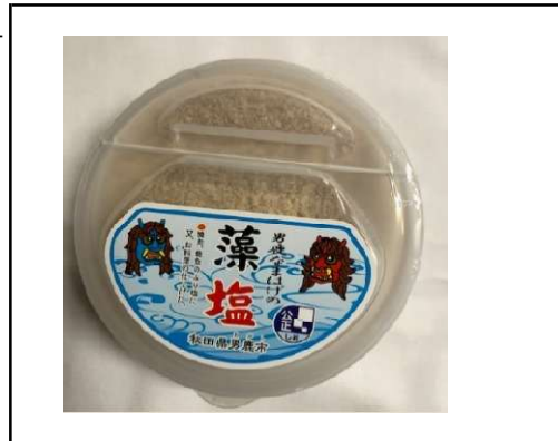
商品名 男鹿半島の藻塩 タッパー入 売価 458円 (税抜) 内容量 80g JANコード 4560172746053