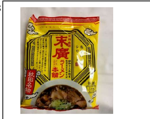
商品名 名店の一杯 末廣ラーメン 売価 350円 (税抜) 内容量 1人前 JANコード 4562418240448