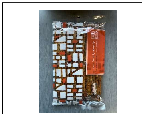
商品名 みそ辛かりんとう 売価 360円 (税抜) 内容量 16枚 JANコード 4955623001261