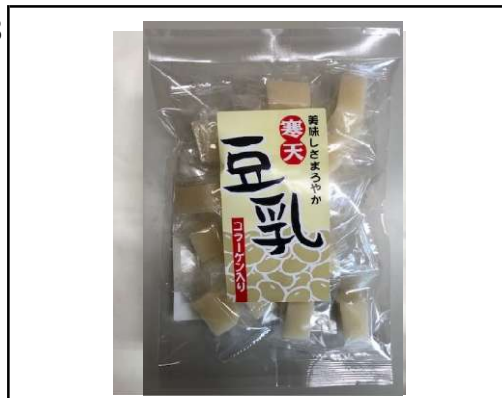
商品名 寒天豆乳 売価 570円(税抜) 内容量 240g JANコード 4979354030086