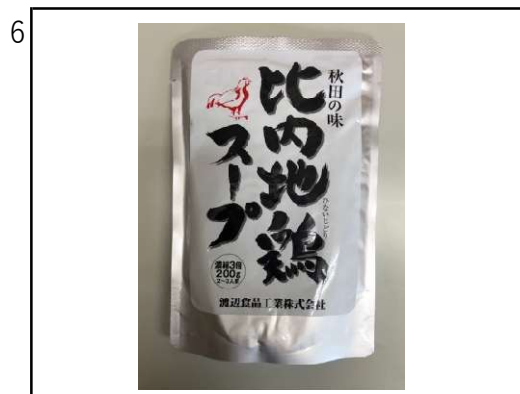
商品名 比内地鶏スープ 売価 280円 (税抜) 内容量 200g JANコード 4956877410069