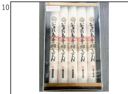
商品名 寛文五年堂稲庭手鞠饅頭 売価 1,500円 (税抜) 内容量80g×5 JANコード 4950034000056