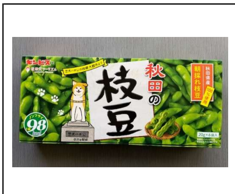
商品名 秋田の枝豆 売価 800円（税抜） 内容量20g×6 JANコード 4589451950097