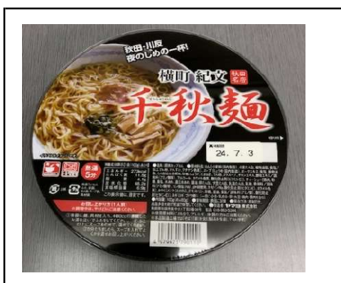
商品名 横町 紀文 千秋麺 (カップ) 売価 500円 (税抜) 内容量 1人前 JANコード 4979971790110