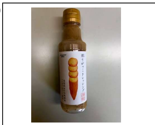
商品名 焼りがっこドレッシング 売価 550円 (税抜) 内容量200g JANコード 4562418240776