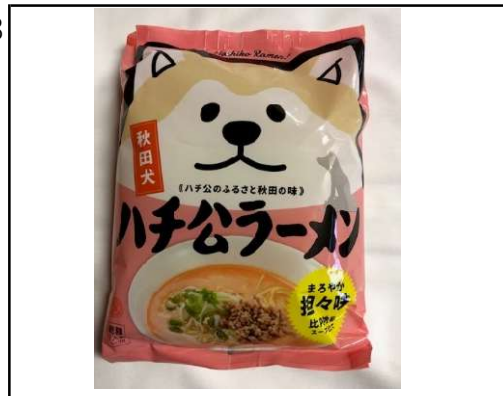
商品名 ハチ公ラーメン まろやか坦々味 売価 300円 (税抜) 内容量 1人前 JANコード 4582438058908