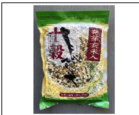
商品名 長命米 売価 500円（税抜） 内容量 240g JANコード 4990855063120