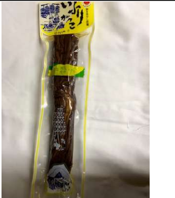
商品名 雄勝野きむらやいぶりがっこLサイズ 売価 759円 (税抜) 内容量 260g JANコード 4969930000039