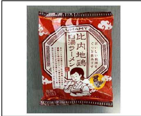
商品名 比内地鶏白湯ラーメン 醤油味 売価 300円 (税抜) 内容量 1人前 JANコード 4562418240103