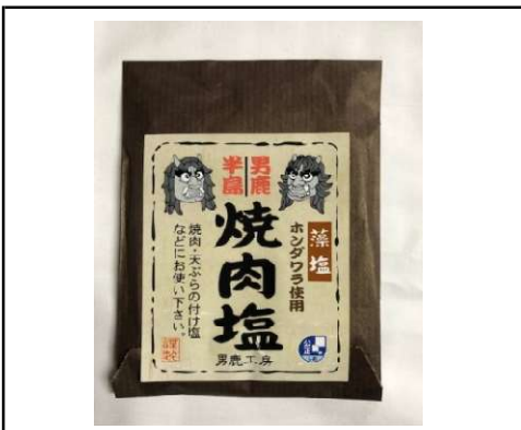
商品名 焼肉塩 売価 220円 (税抜) 内容量 40g JANコード 4560172746312