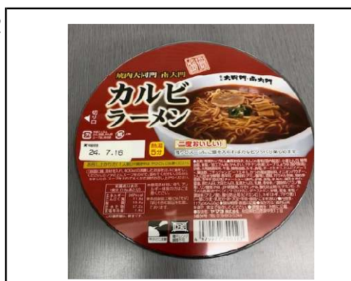
商品名 焼肉大同門・南大門カルピラーメン (カップ) 売価 430円 (税抜) 内容量 1本 JANコード 4979971790127