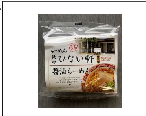
商品名 ひない軒醤油らーめん 売価 350円 (税抜) 内容量 1人前 JANコード 4979971715007