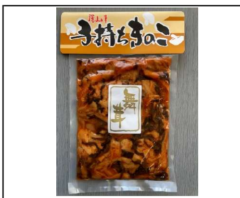
商品名 子持ちきのこ 売価 500円 (税抜) 内容量 250g JANコード 4990855010438