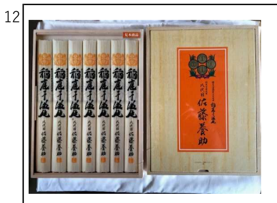
商品名 佐藤養助稲庭干饅頭MYS30N 売価 3,000円 (税抜) 内容量 80g×7 JANコード 4964206003189