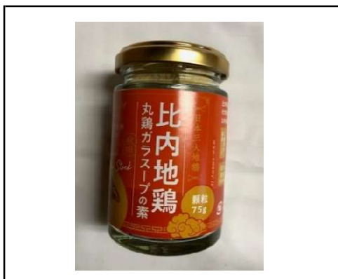
商品名 比内地鶏丸鶏ガラスープの素 売価 550円（税抜） 内容量 75g JANコード 4562418240554