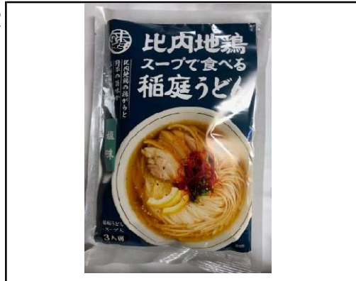
商品名 比内地鶏スープで食べる稲庭うどん 塩味 売価 1,080円 (税抜) 内容量 3人前 JANコード 4997683060314