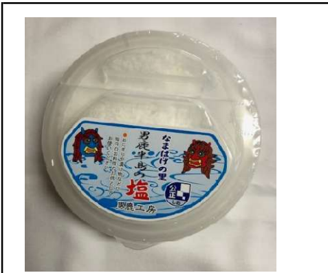
商品名 男鹿半島の塩 タッパー入 売価 348円 (税抜) 内容量 80g JANコード 4560172746046