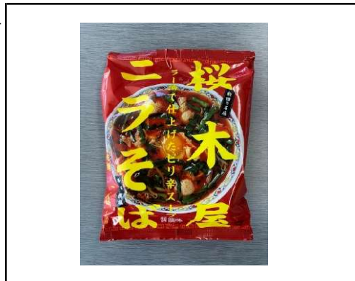
商品名 桜木屋ニラそば 売価 350円 (税抜) 内容量 1人前 JANコード 4582438058977