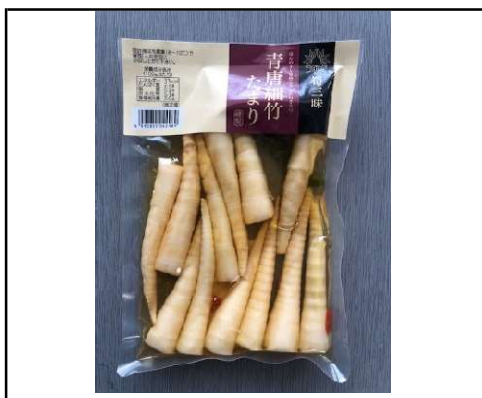
商品名 青唐細竹たまり 売価 500円 (税抜) 内容量 230g JANコード 4990855042989