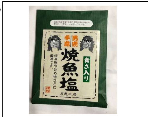
商品名 焼魚塩 売価 220円 (税抜) 内容量 40g JANコード 4560172746329