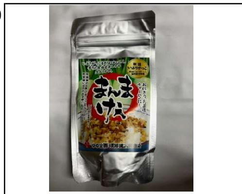
商品名 まんまけえ 売価 426円 (税抜) 内容量 100g JANコード 4580199980247