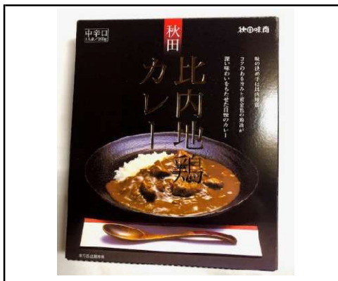
商品名 比内地鶏カレー 売価 600円 (税抜) 内容量 1人前 JANコード 4997683010272