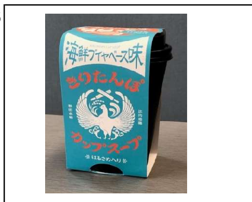
商品名 きりたんぽカップ 海鮮ブイヤベース味 売価 550円（税抜） 内容量 106g JANコード 4582438051114