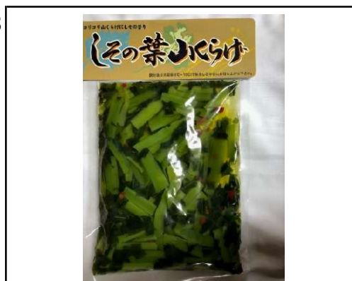
商品名 しその葉山くらげ 売価 500円 (税抜) 内容量 350g JANコード 4990855042668