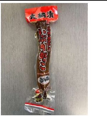
商品名 大網漬いぶり Lサイズ 売価 756円 (税抜) 内容量 1本 JANコード 4906895000049