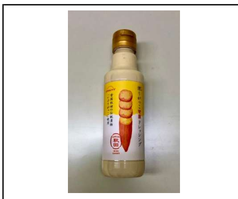
商品名 いぶりがっこマヨドレッシング 売価 550円 (税抜) 内容量 200g JANコード 4562418240868