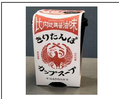
商品名 きりたんぽカップ 比内地鶏醤油味 売価 550円（税抜） 内容量 106g JANコード 4582438051107