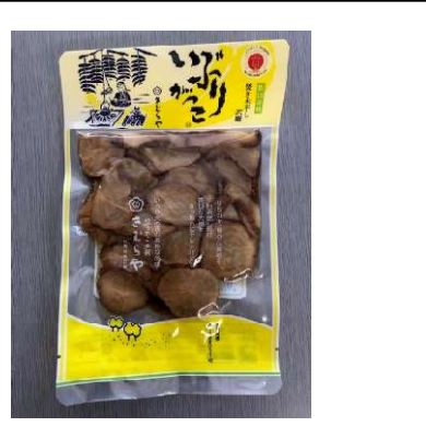
商品名 雄勝野きむらやいぶりがっこスライス 売価 541円 (税抜) 内容量 150g JANコード 4969930000664