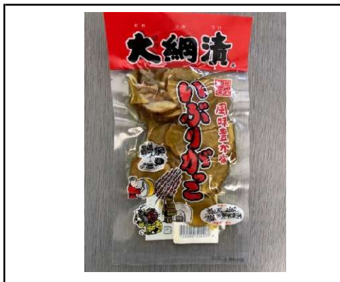
商品名 大綱漬いぶり スライス 売価 530円 (税抜) 内容量 150g JANコード 4906895000223