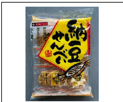
商品名 納豆せんべい 売価 250円 (税抜) 内容量11枚 JANコード 4970311045686