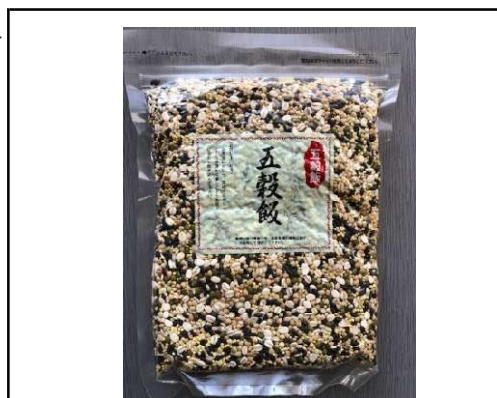
商品名 五穀飯 売価 500円（税抜） 内容量 450g JANコード 4990855090614