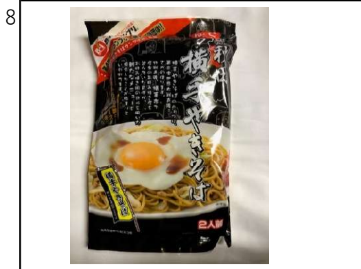
商品名 横手焼きそば (袋) 売価 550円 (税抜) 内容量 2人前 JANコード 4920539150204