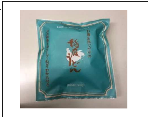
商品名 稲庭うどん 白湯 即席 売価500円 (税抜) 内容量 1人前 JANコード 4909107000790