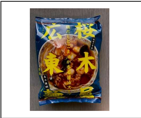
商品名 桜木屋 広東麵 売価 350円 (税抜) 内容量 1人前 JANコード 4582438058984