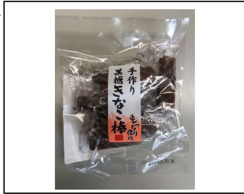
商品名 黒糖きなこ棒 売価 220円(税抜) 内容量 8本 JANコード 4955623001766