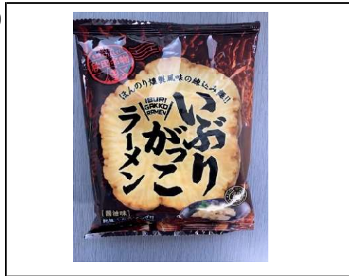
商品名 いぶりがっこラーメン 売価 330円 (税抜) 内容量 1人前 JANコード 4582438058892