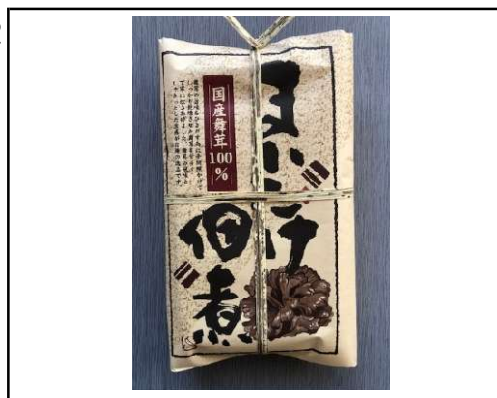
商品名 まいたけ佃煮 売価 600円（税抜） 内容量 180g JANコード 4990855050434