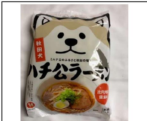
商品名 ハチ公ラーメン 比内地鶏醤油味 売価 300円 (税抜) 内容量 1人前 JANコード 4582438058885