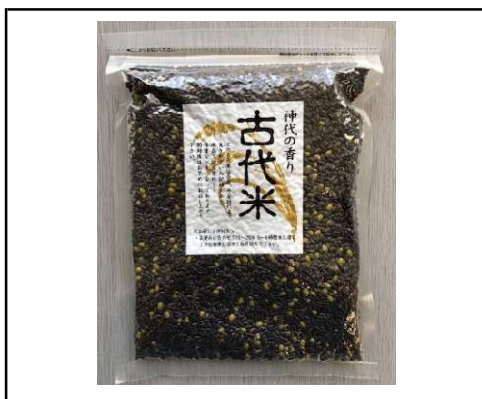
商品名 古代米 売価 500円（税抜） 内容量 400g JANコード 4990855080622