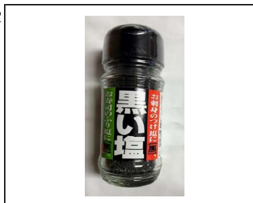
商品名 黒い塩 売価 500円 (税抜) 内容量 40g JANコード 4560172747005