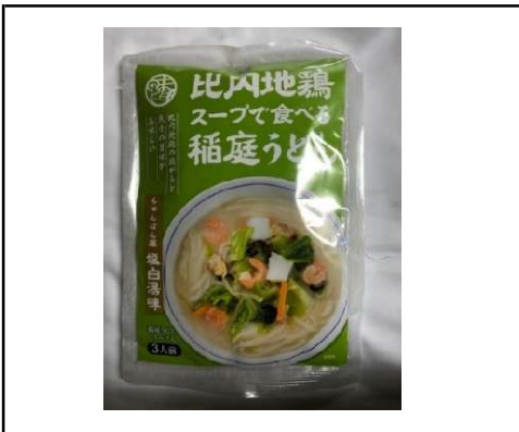
商品名 比内地鶏スープで食べる稲庭うどん 塩白湯味 売価 1,080円 (税抜) 内容量 3人前 JANコード 4997683060338