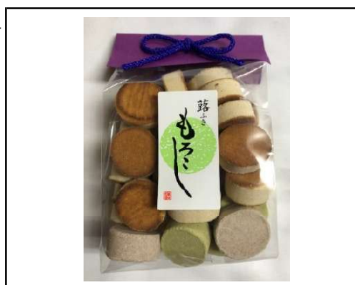
商品名 落巾着もろこし 売価 350円 (税抜) 内容量 120g JANコード 4954023015311