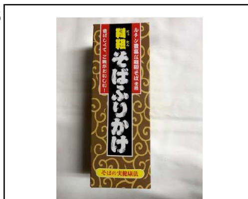
商品名 韃靼そばふりかけ 売価 500円（税抜） 内容量 90g JANコード 4964888430204