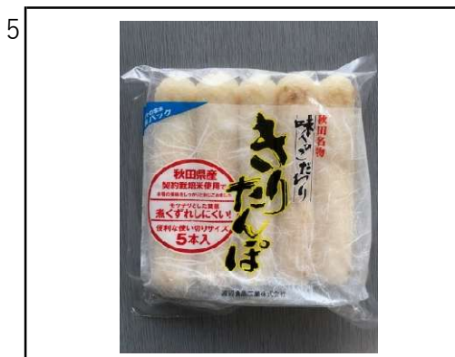
商品名 きりたんぽ5本入り (袋) 売価 630円 (税抜) 内容量 70g×5 JANコード 4956877980036