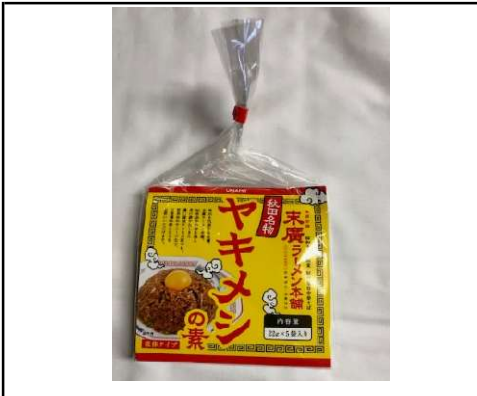
商品名 末廣ヤキメシの素 売価 420円 (税抜) 内容量 22g×5 JANコード 4562418240455