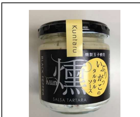
商品名 いぶりがっこタルタルブラックペッパー 売価 750円 (税抜) 内容量 150g JANコード 4969670025224