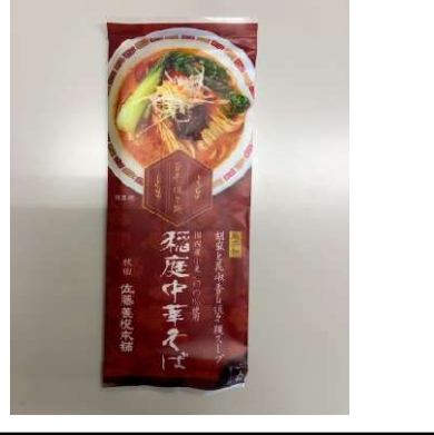
商品名 稲庭中華そば 坦々スープ 売価 700円 (税抜) 内容量 2人前 JANコード 4992099000961