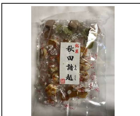
商品名 三色つつみもろこし 売価 350円 (税抜) 内容量 130g JANコード 4963216101199