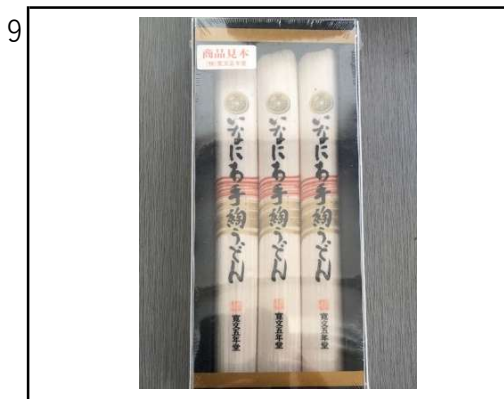
商品名 寛文五年堂稲庭手鞠饅頭 売価 1,000円 (税抜) 内容量80g×3 JANコード 4950034000032