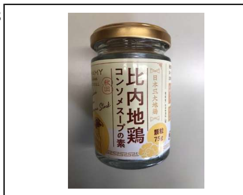
商品名 比内地鶏コンソメスープの素 売価 550円（税抜） 内容量 75g JANコード 4562418240783