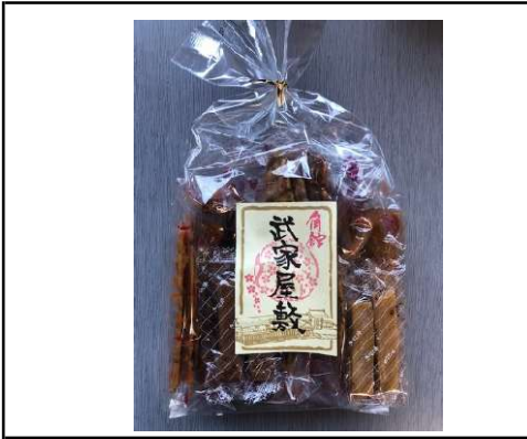
商品名 かりんとう詰合せ(武家屋敷) 売価 630円(税抜) 内容量 14本 JANコード 4955623001629