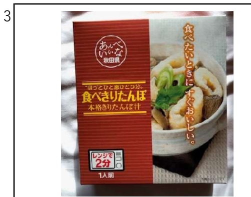
商品名 食べきりたんぽ 売価 600円 (税抜) 内容量 1人前 JANコード 4956877410014