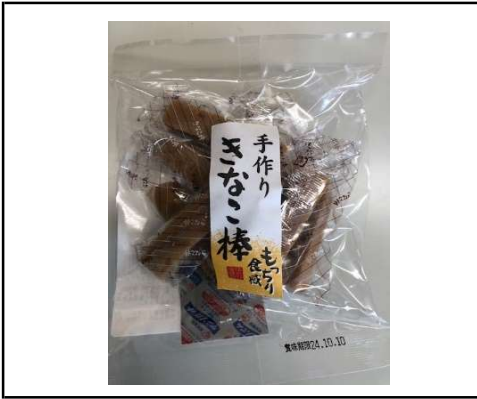
商品名 きなこ棒 売価 220円(税抜) 内容量 8本 JANコード 4955623001759