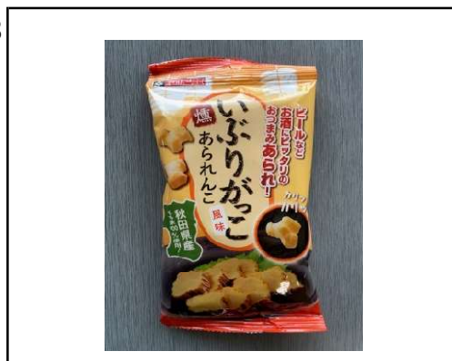
商品名 いぶりがっこ風味あられんこ 売価 150円 (税抜) 内容量 40g JANコード 4970311056494