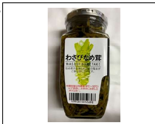
商品名 わさびなめ茸 売価 600円 (税抜) 内容量 370g JANコード 4990855052698