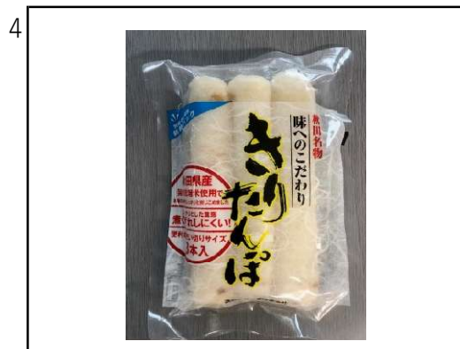
商品名 きりたんぽ3本入り (袋) 売価 390円 (税抜) 内容量 70g×3 JANコード 4956877970037