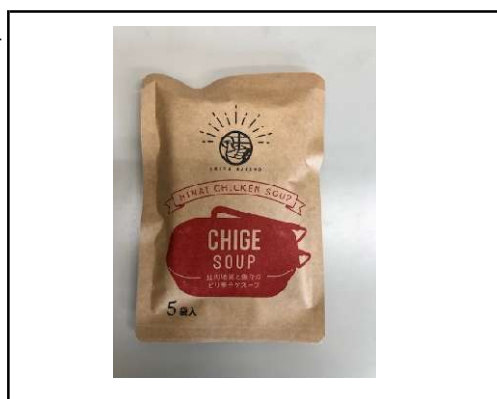
商品名 比内地鶏と魚介のピリ辛チゲスープ 売価 280円 (税抜) 内容量 90g JANコード 4997683050391