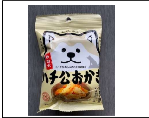
商品名 ハチ公おかし 売価 230円(税抜) 内容量35g JANコード 4582438058571