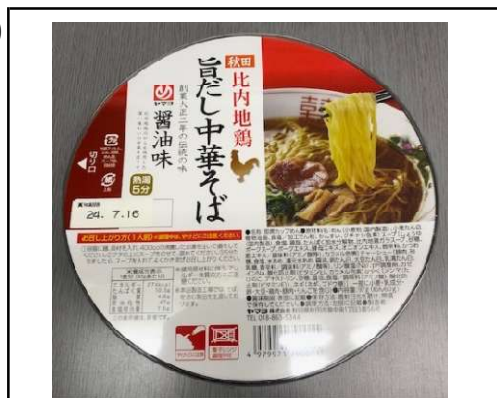
商品名 比内地鶏旨だし中華そば（カップ） 売価 500円（税抜） 内容量 1人前 JANコード 4979971790011