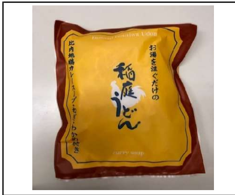
商品名 稲庭うどん カレー味 即席 売価500円 (税抜) 内容量 1人前 JANコード 4909107000745