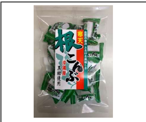
商品名 根昆布寒天 売価 570円(税抜) 内容量 240g JANコード 4979354030079