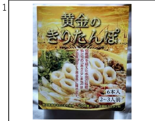
商品名 黄金のきりたんぽ6本入 売価 770円 (税別) 内容量 2~3人前 JANコード 4956877410014