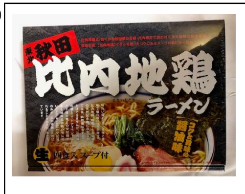
商品名 比内地鶏ラーメン 売価 1000円 (税抜) 内容量 4食入り JANコード 4972874605574