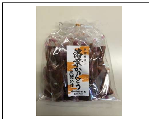
商品名 落葉かりんとう巾着黒糖がけ 売価 260円 (税抜) 内容量 5本 JANコード 4955623003326