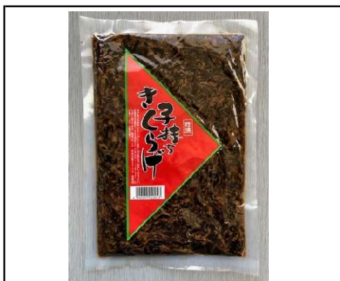
商品名 子持ちきくらげ 売価 500円（税抜） 内容量 280g JANコード 4990855040053