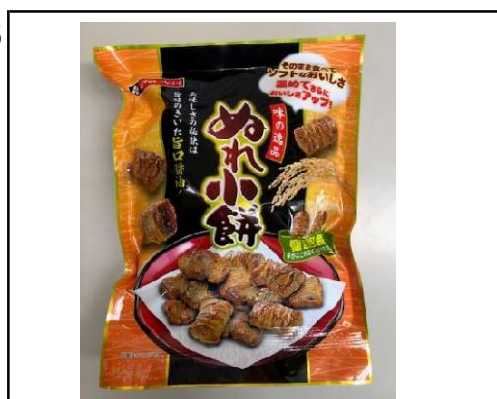
商品名 ぬれ小餅 売価 350円 (税抜) 内容量 140g JANコード 4970311200085