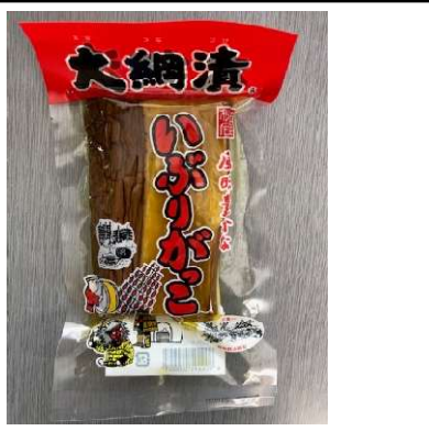
商品名 大網漬いぶり ミニ 売価 550円 (税抜) 内容量150g JANコード 4906895000025