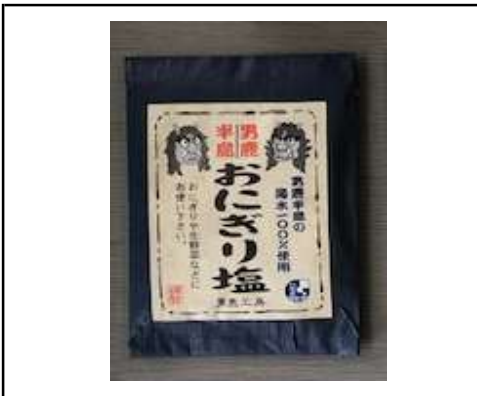
商品名 おにぎり塩 売価 220円 (税抜) 内容量 40g JANコード 4560172746305