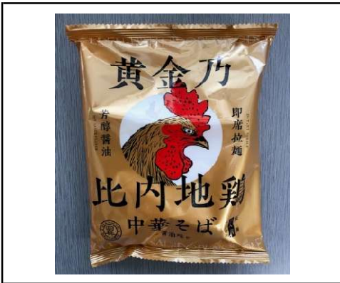
商品名 黄金乃比内地鶏中華そば 売価 300円 (税抜) 内容量 1人前 JANコード 4582438058878