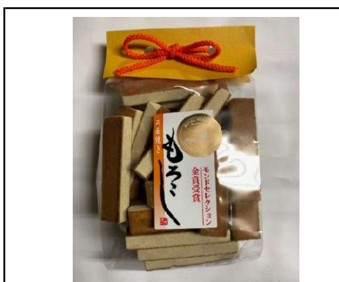
商品名 両面巾着もろこし 売価 350円 (税抜) 内容量 120g JANコード 4954023015014