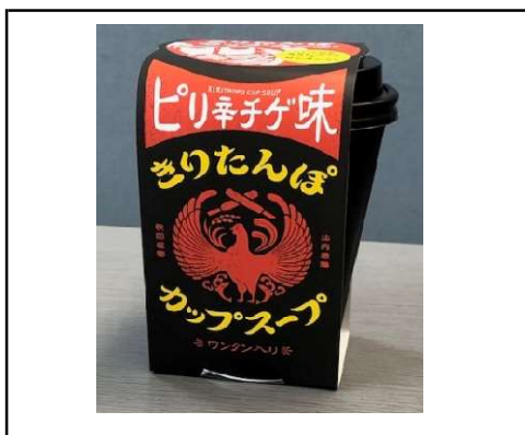
商品名 きりたんぽカップ ピリ辛チゲ味 売価 550円（税抜） 内容量 106g JANコード 4582438051169