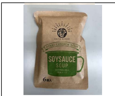
商品名 比内地鶏と鰹の和風スープ 売価 380円 (税抜) 内容量 14g×6 JANコード 4997683050407