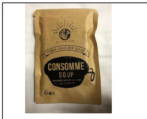
商品名 比内地鶏と玉ねぎ・ポークコンソメスープ 売価 380円 (税抜) 内容量 14g×6 JANコード 4997683050414