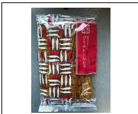
商品名 ぴり辛かりんとう 売価 360円 (税抜) 内容量 16枚 JANコード 4955623001285